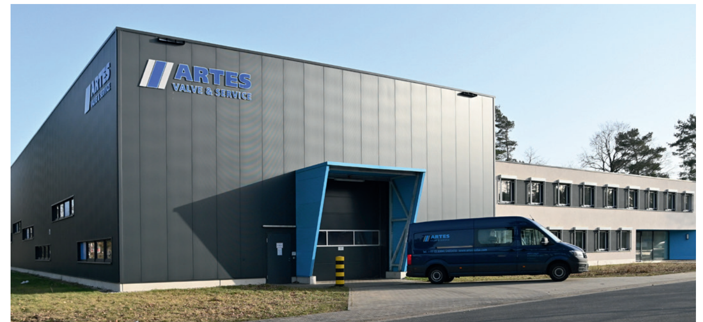
Der Hauptsitz der ARTES Valve & Service GmbH in Velten, Land Brandenburg, Deutschland.